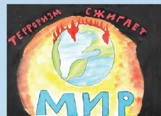
Вероника Г., 15 лет