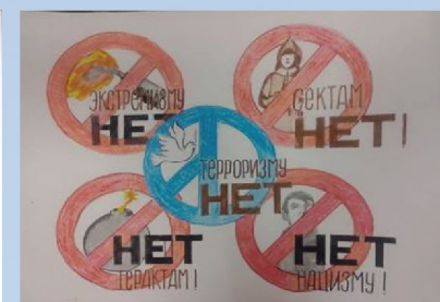
Руслан Л, 13 лет