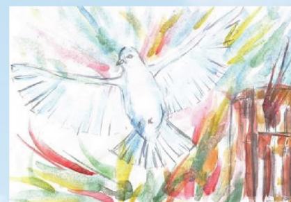
Наташа К., 12 лет